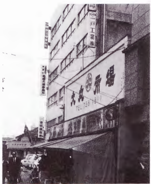
'68年、事務所開業の地。

初代事務所の前で、 このとき本多はのち に南部事務所の事務 局長になるとは夢に も思わなかった…… に違いない。