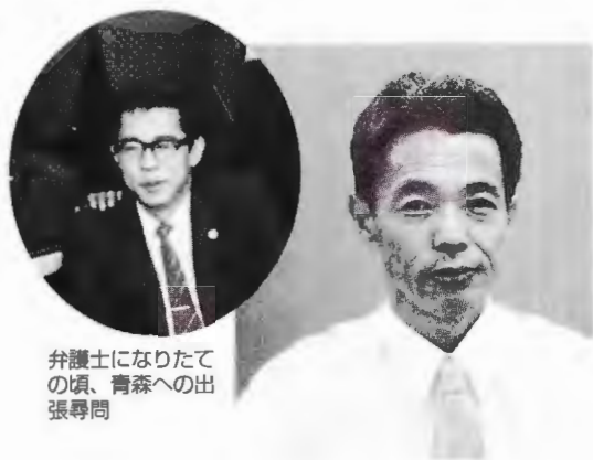
弁護士になりたての頃、青森への出張時

今年は事務所の三〇周年と私の弁護士生活三〇年の会が重なった。両者の間には一年のずれがあるのだが、事務所は満で、司法研修所卒業以来の年行事はかぞえて教えているせいである。つまり私は、事務所開設一年経ったところで入所した生え抜き一期生になる。以来三〇年、縁もゆかりもなかった大田区のこの事務所、関わりがあった二〇数名の他のどの弁護士よりも長い日々を送り、とうに第一の故郷となって今に至っている。