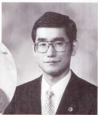
30年前、自宅の庭のかまぐらで...

日本航空、パンナム、ルフトハンザ航空、エアインディア、スカンジナビア航空、フィンランド航空など航空関係、ソニー労組、金属関係や地域のような労働事件を担当し、多くの人々とふれあうことができました。この夏は総括のつもりで、日本評論社から出版する労働法の法