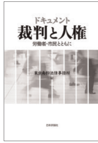
ドキュメント 裁判と人権 労働者・市民とともに 日本評論社 定価2,100円+税