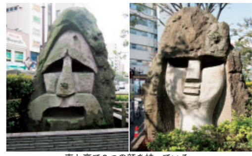
表と裏で2つの顔を持っている。

うの?!と思ったが、実はこの2つはまったくの別物であった。かの有名な、イースター島にある巨大な顔の像は「モヤイ像」。対する「モヤイ像」は、日本でモヤイ像をモデルにして作ったものだったのだ。